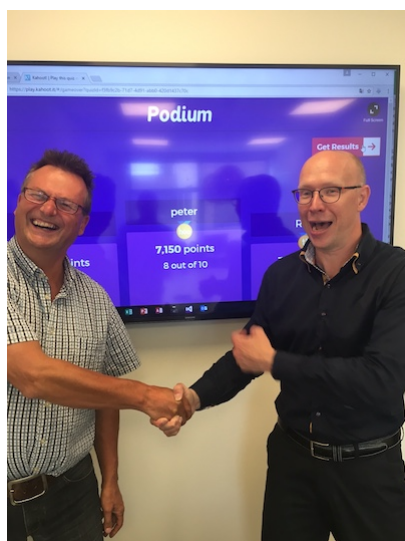
'One minute of fame'